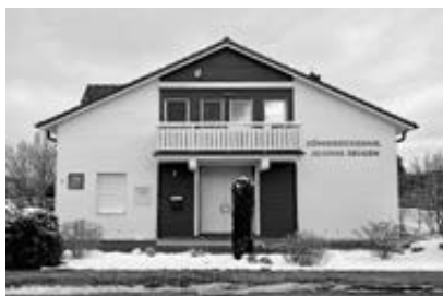
Königreichssaal der Zeugen Jehovas in Schaafheim